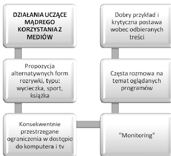
Rysunek 3. Wychowawcze działania dotyczące właściwego korzystania z mediów

Budowanie tożsamości, jej rozpoznanie i ochrona przed niszczącymi czynnikami jest dziś prawdziwym wyzwaniem dla pedagogiki jako nauki, nauczycieli troszczących się o wychowanie uczniów i rodziców powołanych do troski o rozwój swych dzieci. Telewizja, internet, prasa mogą być skutecznym „sprzymierzeńcem” w pracy dydaktyczno-wychowawczej. Mogą także niestety stać się poważnym zagrożeniem natury moralnej, społecznej, zdrowotnej dla współczesnego człowieka. Osobom badanym zadano na drodze ankietowania pytanie dotyczące właściwego, tj. bezpiecznego i rozwijającego człowieka sposobu korzystania z mediów elektronicznych. Uzyskane odpowiedzi przedstawić możemy w następujący sposób.