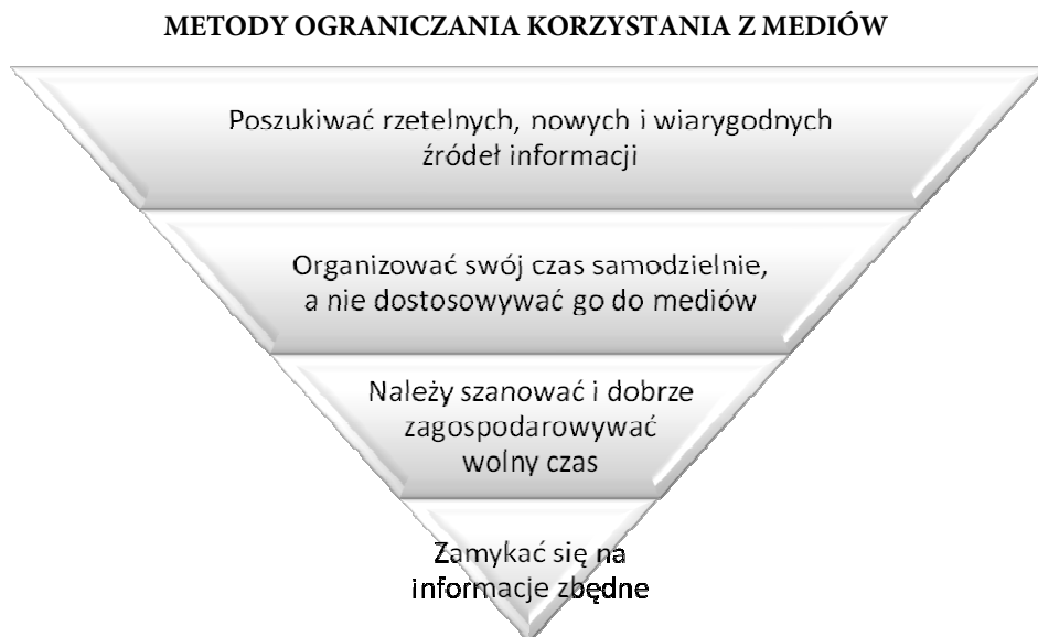
Rysunek 1. Proponowane przez badanych sposoby ograniczania zbytniego korzystania z mediów.

Uzyskane od respondentów wypowiedzi pozwalają na ważne z punktu widzenia pedagogiki mass-mediów wnioski. Osoby badane w związku z postawionym na drodze ankietowania problemem dotyczącym sposobów ograniczania zbyt nadmiernego korzystania z mediów udzieliły różnych odpowiedzi. Zebrane opinie i poglądy z tego zakresu przedstawia rysunek 1.