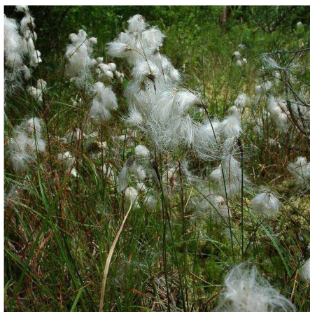
Fot. 2. Welnianka wąskolistna