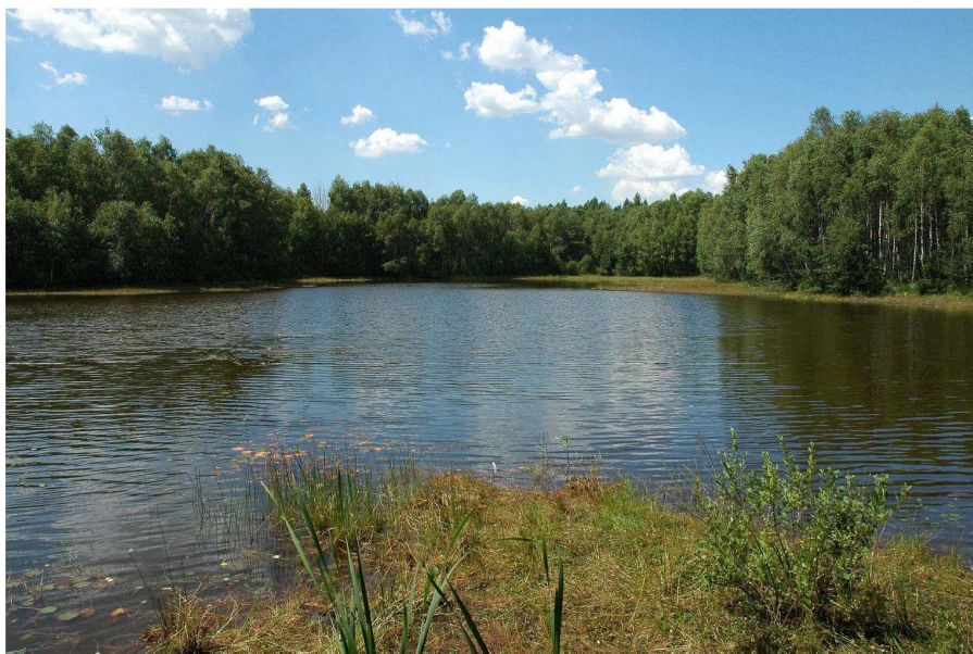
Fot. 1. Śródleśny staw w Wilamowie

nej Vaccinium uliginosum , bagna zwyczajnego Ledum palustre i welnianki pochwowatej Eriophorum vaginatum . W runie mszystym dominują kępy płonnika Polytrichum attenuatum i torfowców Sphagnum sp. Składem gatunkowym runa zbiorowisko to nawiązuje do zespołu boru bagiennego Vaccinio uliginosi-Pinetum .