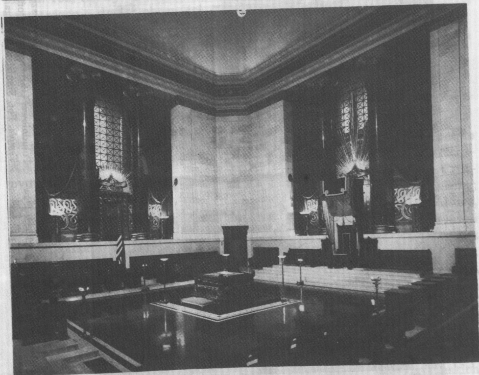
House of the Temple, siedziba Rady Najwyższej 33° w Waszyngtonie przy Szesnastej Alei. Poniżej wewnątrz Świątyni w House of the Temple.