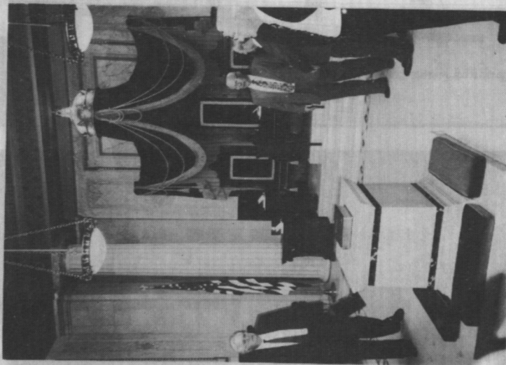
Sala posiedzeń Rady Najwyższej 33° Obediencji Południowej USA w waszyngtońskim House of the Temple .