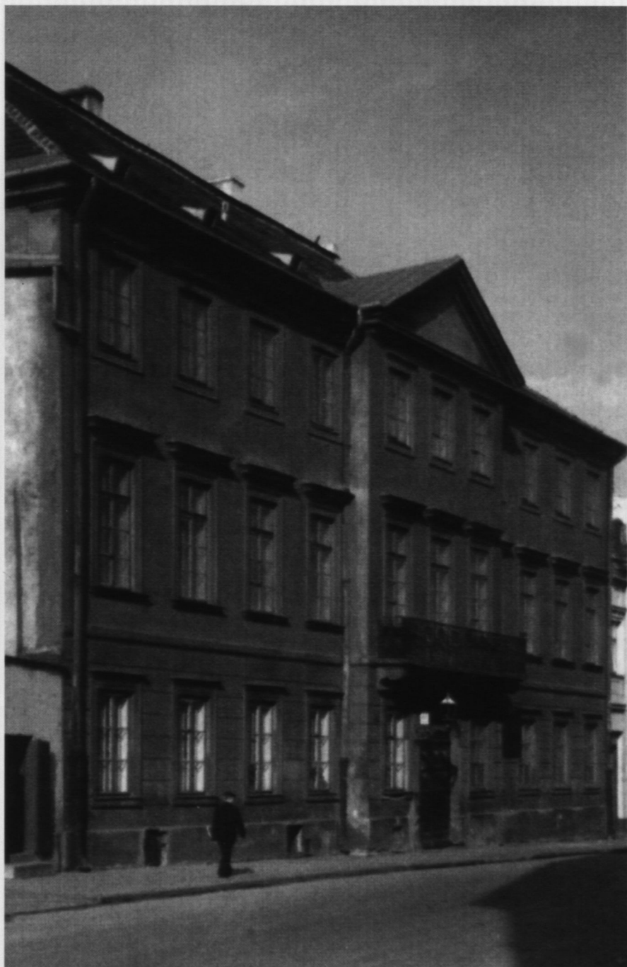
1. Kamienica przy ul. Podwale 15 – siedziba Muzeum Narodowego w latach 1916-1932.