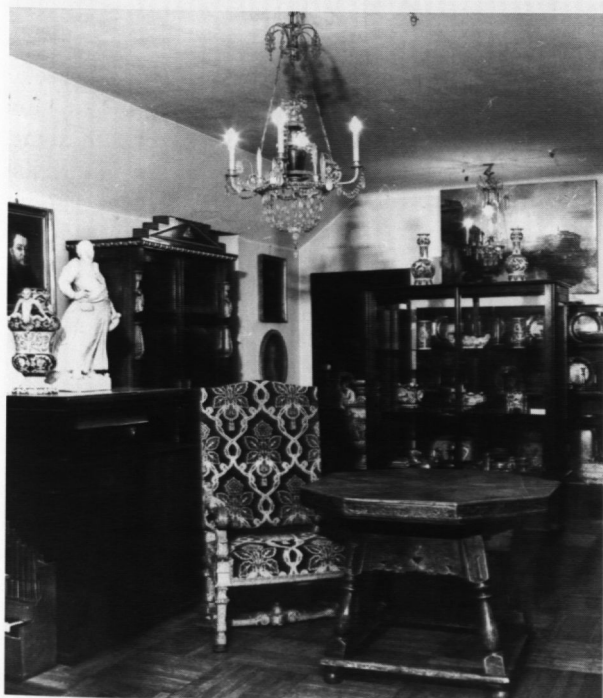
22. Magazyn Rzemiosła Artystycznego, 1976 r.