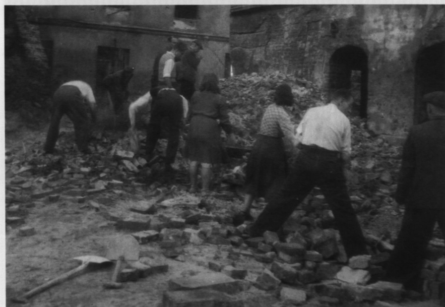
6. Pracownicy Muzeum przy odgruzowywaniu dziedzińców, 1949 r.