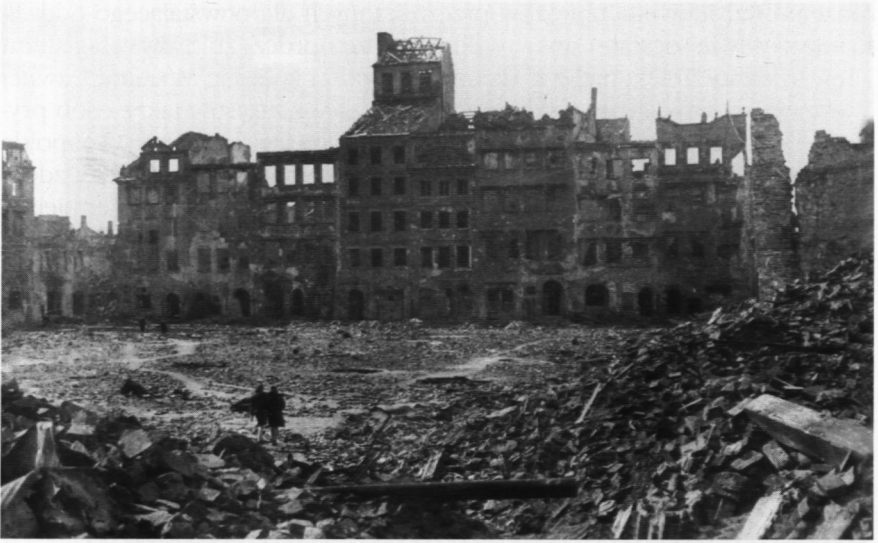
4. Strona Dekerta, 1945 r.

ownie i magazyny muzealne 11 . Ekspozycję muzealną zamierzano udostępnić publiczności w roku 1940. Informował o tym „Ekspres Poranny” z 25 V 1939 w artykule zatytułowanym „Jak będzie wyglądało Muzeum Warszawy na Starym Mieście”: Sal ma być 26. Materiał będzie zgromadzony w układzie chronologicznym i według poszczególnych zagadnień życia Warszawy. Tak zresztą jak to już uczyniono na wystawie „Warszawa wczoraj, dziś i jutro”. W kamienicy Baryczków znajdą się materiały historyczne od najdawniejszych czasów, a więc plany i widoki, dokumenty, stare sztychy itp. W sąsiedniej kamienicy Schlichtingowskiej, którą miasto nabyło od Pen Clubu będą umieszczone m.in. zabytki cechowe. Wreszcie w kamienicy „Pod Murzynkiem” będziemy oglądali pamiątki po wielkich Polakach, których życie bodaj na krótki okres związało z Warszawą. I choć na przeszkodzie tym planom stanęła wojna, to aż do jej wybuchu trwało przenoszenie na Rynek zbiorów przeznaczonych dla organizowanej placówki. W atmosferze zagrożenia wojennego pakowano je do specjalnych skrzyń, wykonanych z myślą o ewentualności dłuższego składowania w piwnicach lub schronach 12 .