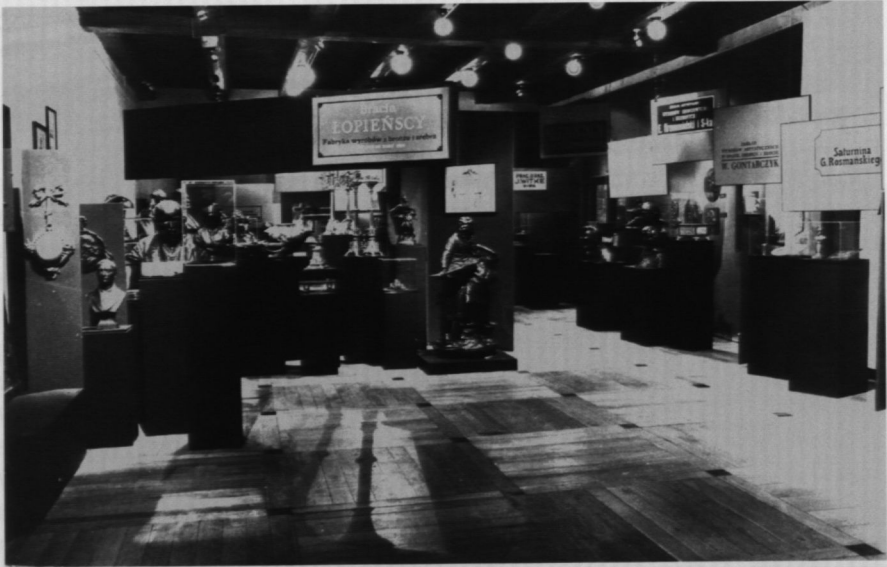
15. Wystawa „Od guzika do pomnika. Brązownictwo warszawskie XIX i XX w.”, 1996 r.