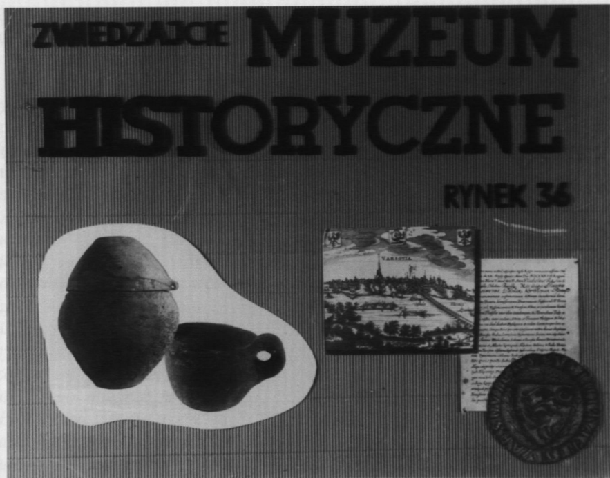
7. Plakat muzealny, 1952 r.