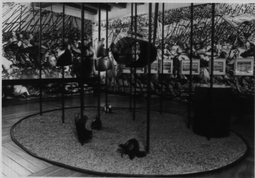
12. Warszawa w latach „potopu” szwedzkiego - fragment ekspozycji stałej.