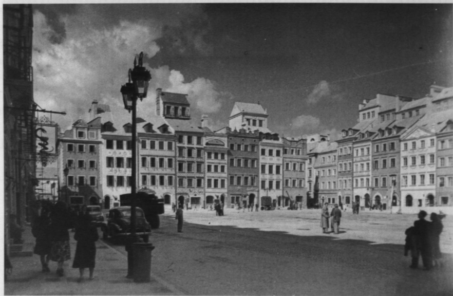
8. Rynek Starego Miasta po odbudowie, lipiec 1953 r.