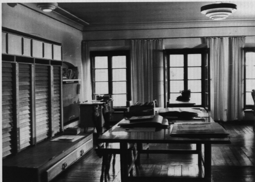
23. Gabinet Rycin, proj. S. Zamecznik.