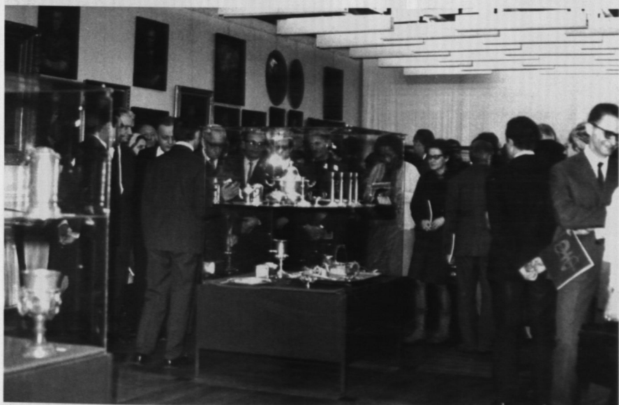
14. Otwarcie wystawy „Dary i nabytki”, 15 I 1970 r.