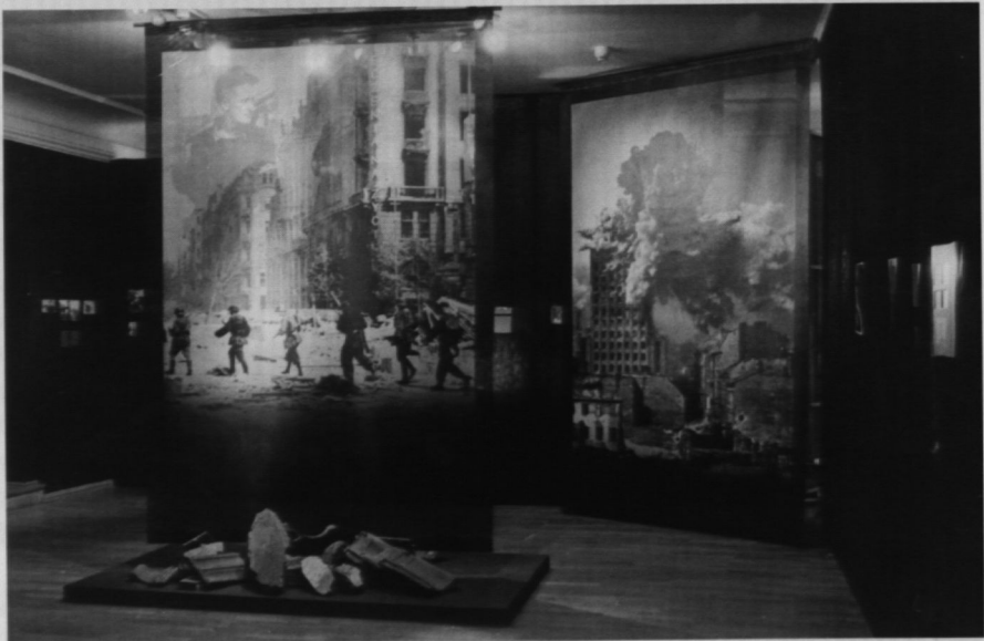
16. Wystawa „Powstanie Warszawskie w obiektywie powstańczych fotoreporterów”, 2004 r.