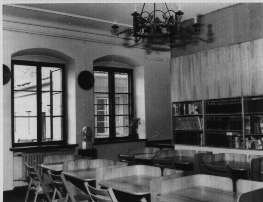
24. Czytelnia biblioteczna, proj. S. Zamecznik.