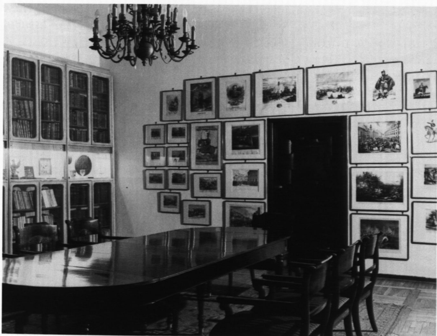
21. Gabinet im. Ludwika Gocla, proj. S. Zamecznik, 1973 r.