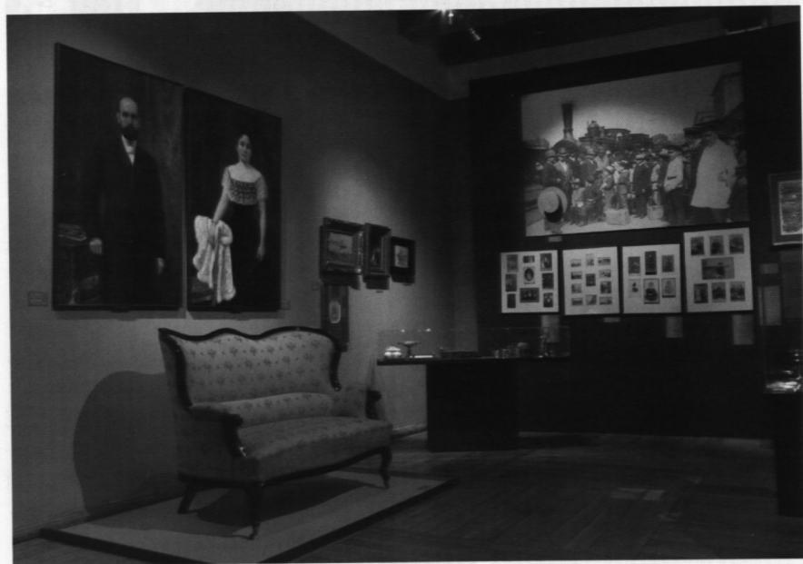
28. „Dary i darczyńcy” - fragment wystawy jubileuszowej, 2006 r.