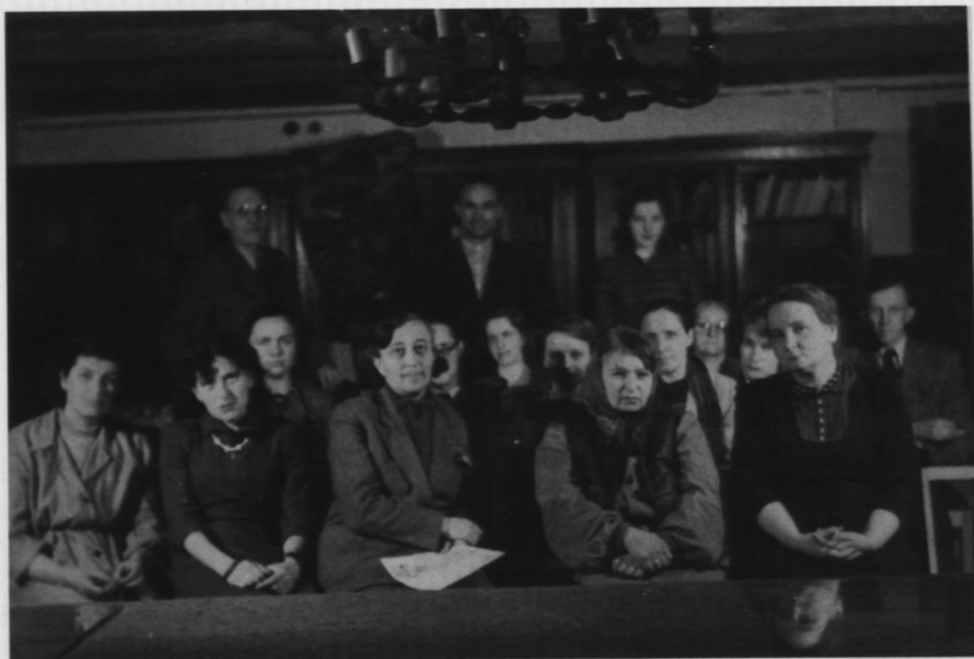
9. Personel Muzeum ok. 1954 r.