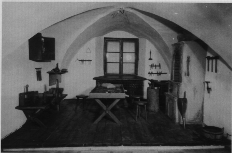
11. Rekonstrukcja warsztatu złotniczego z 1 poł. XVII w. - fragment ekspozycji stałej.