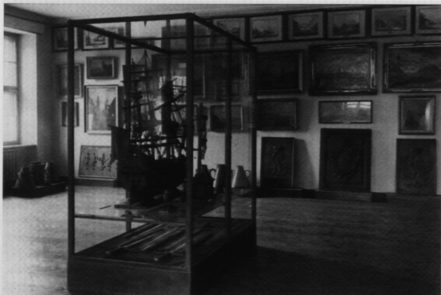
2. Sala „Dawna Warszawa” w gmachu Muzeum Narodowego w al. 3 Maja, 1935 r.