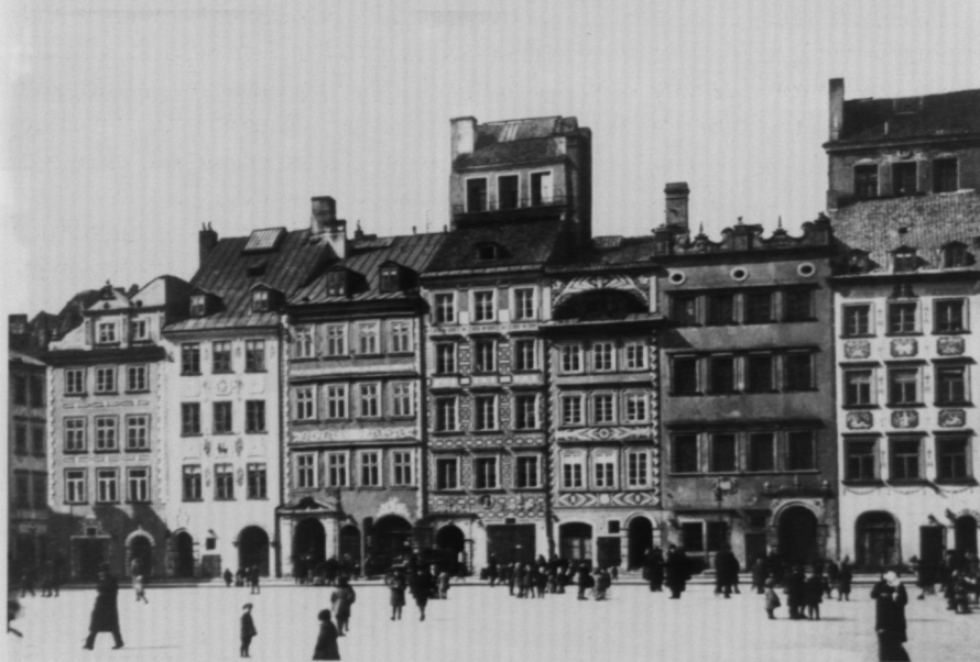
3. Kamienice: Pod Murzynkiem, Schlichtingowska i Baryczkowska – siedziba Muzeum Dawnej Warszawy, 1938 r.