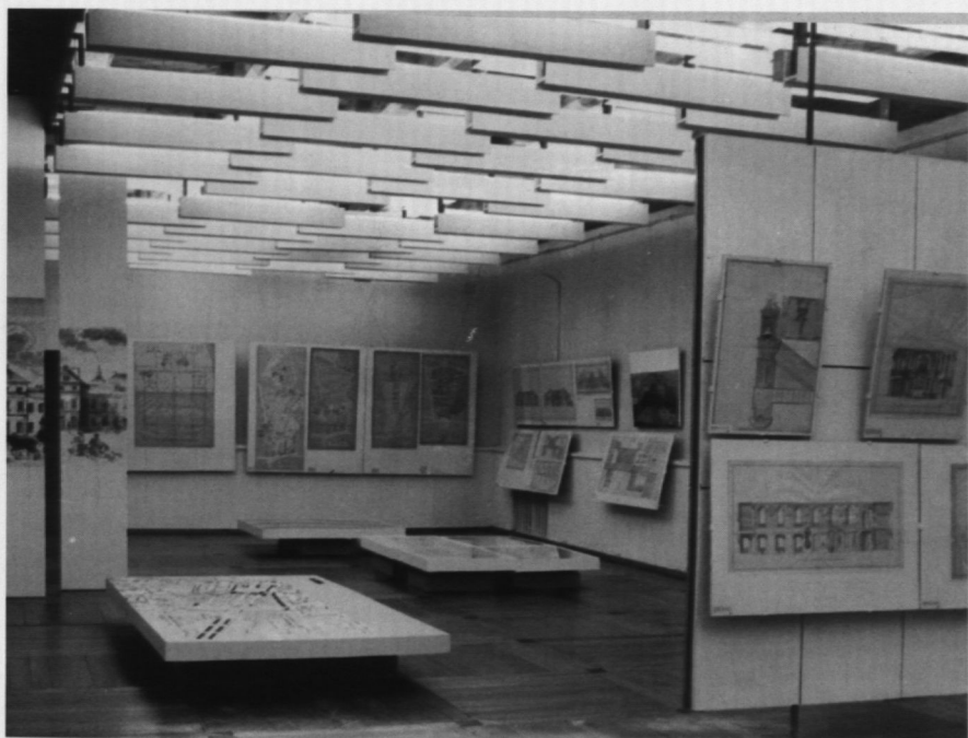
13. Wystawa „Varsaviana w zbiorach drezdeńskich”, 1965 r.