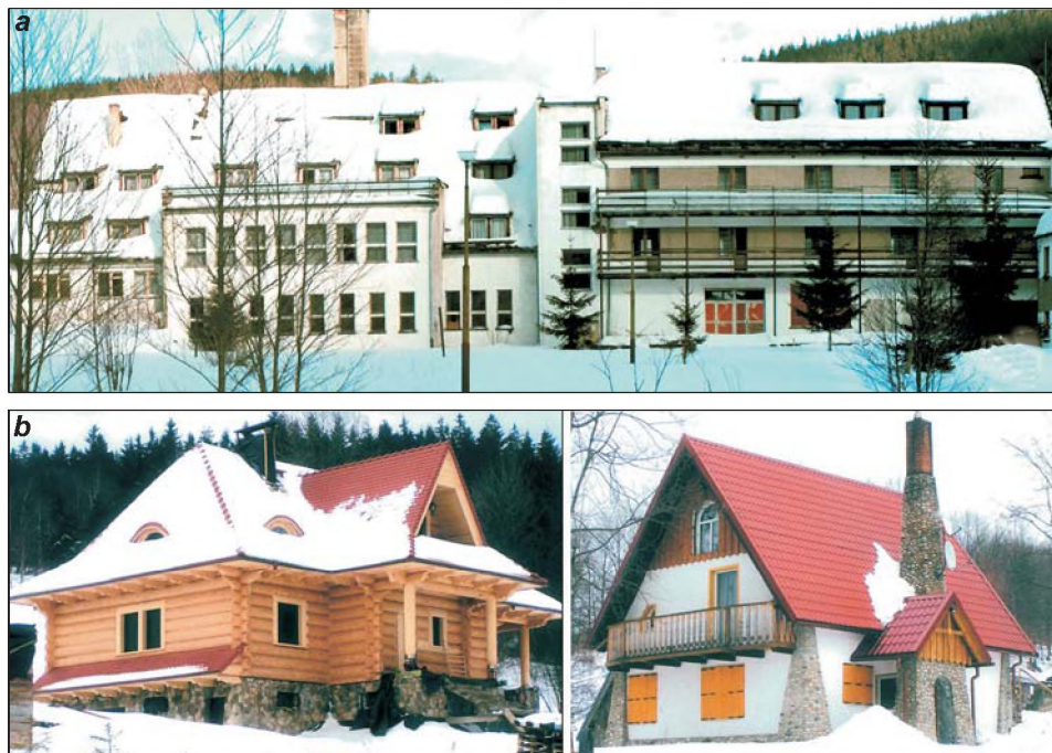
Rys. 4. Wieś Orłowice – wybrane elementy turystycznej infrastruktury pobytowej a) aktualnie nieużytkowany dom wypoczynkowy „Orlik“, b) domy letniskowe jako przykład chaotycznej kompozycji oraz braku skorelowania z cechami lokalnego stylu budowlanego