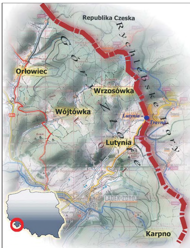
Rys. 1. Lokalizacja obiektów badawczych Fig. 1. Location of research objects