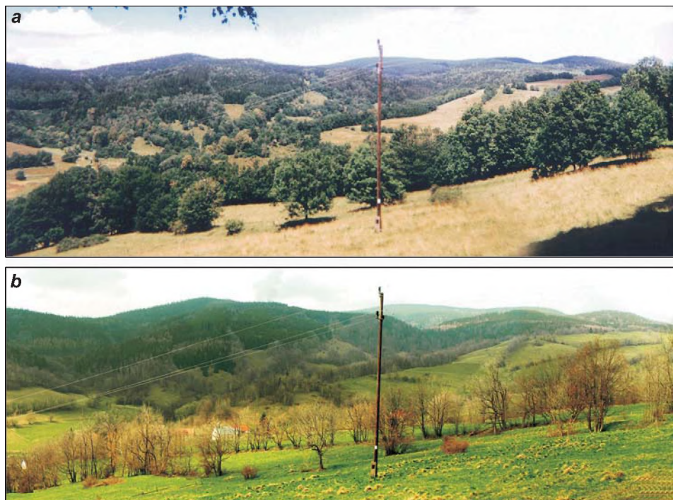
Rys. 3. Współczesny krajobraz wsi Lutynia – widok części wschodniej zarejestrowany: a) latem, b) wiosną