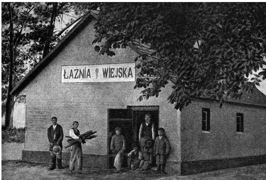
Fot. 1. Łaźnia wiejska w Cieleśnicy